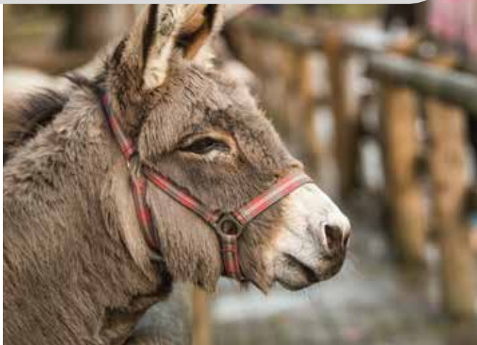
Tierpark Gysenberg, Herne