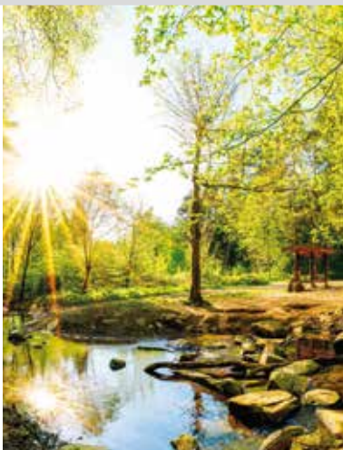
Bäche in Düsseldorf

Die vielfältige Bachlandschaft Düsseldorfs lässt sich bei der Wanderung „Vom Rothhäuser Bachtal zur Düssel“ entdecken. Nicht weit von Straßen und Stadt eröffnet sich Naturfreunden eine eigene kleine Welt: Vorbei an dichten Beerensträuchern und hohen Bäumen folgen die Wanderwege verschiedenen Teichen sowie Bächen, etwa dem Hubbelrather Bach oder dem Stinderbach. Mit munterem Plätschern im Ohr führt der Weg während der dreistündigen Wanderung auch zu einem Bauernhof mit Pferdekoppel, wo die sanften Tiere beim Grasens beobachten werden können. Stärkende Mahlzeiten für Wanderer verkauft am Wochenende die Stinder Mühle, die einen gemütlichen Ort zur Einkehr sowie einen Minigolfplatz bietet. Ansonsten lädt die herrliche Landschaft dazu ein, inmitten der Natur kleine Pausen einzulegen und umgeben von den lebendigen Geräuschen des Waldes die Seele baumeln zu lassen. Durch die Nähe zum Wasser sollten Wanderer bei der Tour wasserfestes Schuhwerk und passende Kleidung tragen, um auch auf matschigen Wegen problemlos voranzukommen.