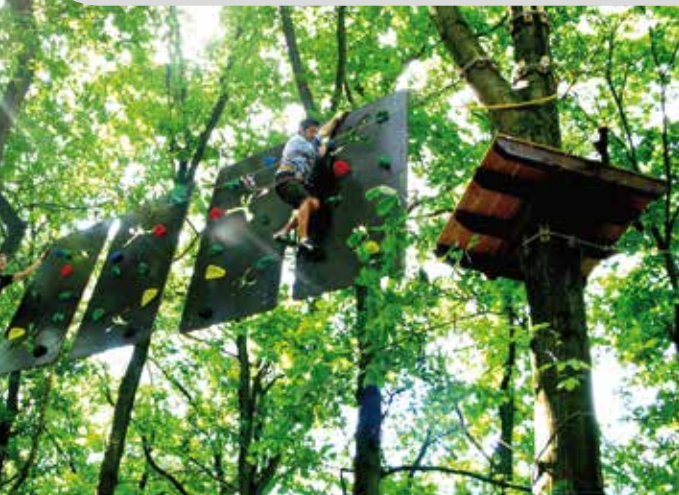
Tree2Tree Hochseilgarten, Duisburg