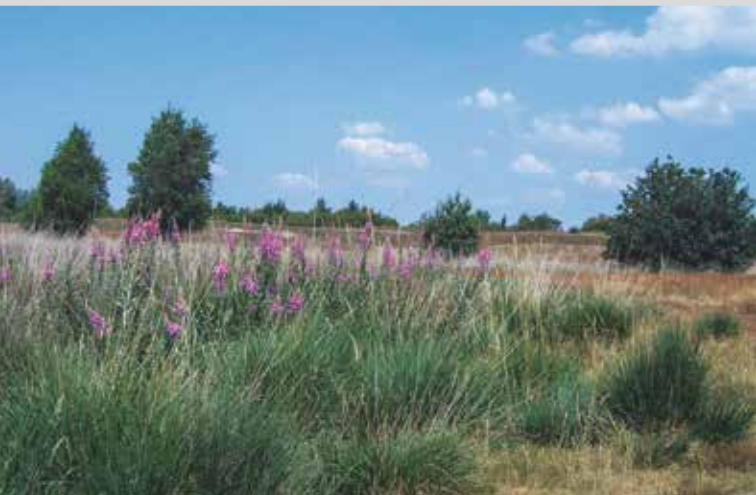
Wisseler Dünen, Kalkar