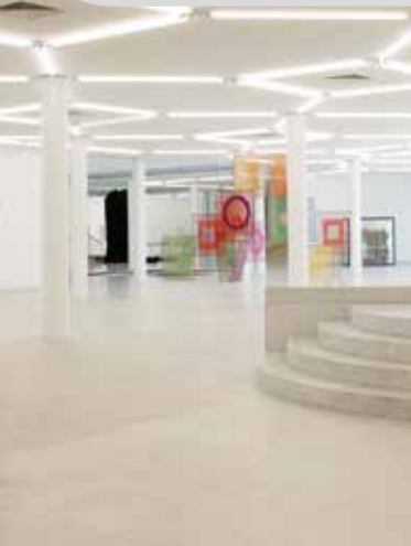
Museum Abteiberg, Mönchengladbach