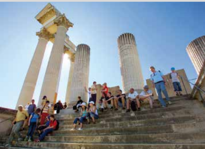
LVR-Archäologischer Park, Xanten