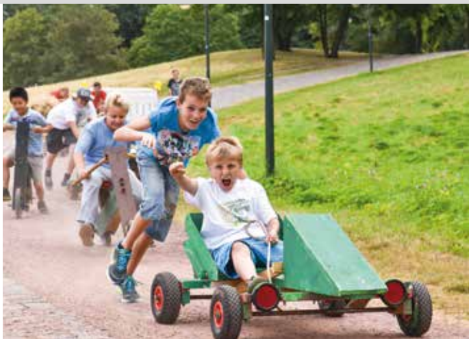
Aktion & Kultur mit Kindern, Düsseldorf