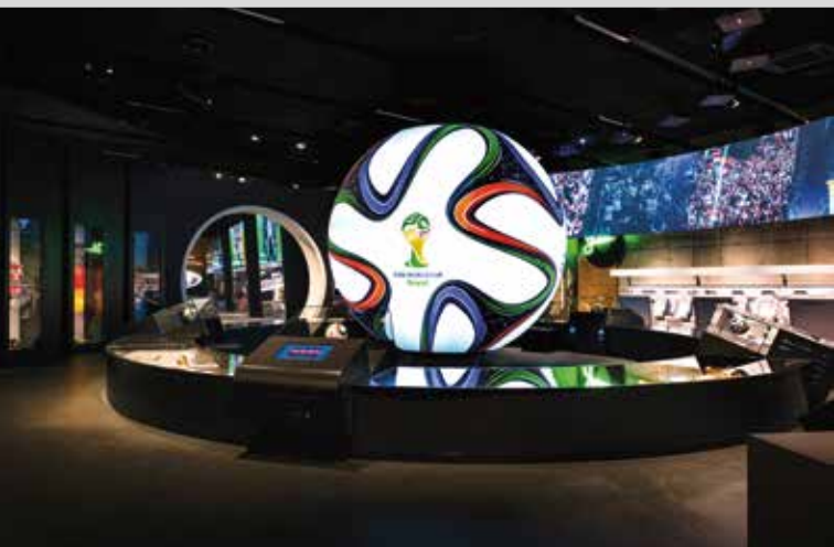
Deutsches Fußballmuseum, Dortmund