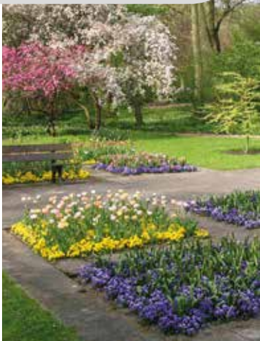
Botanischer Garten, Krefeld

Versteckt hinter europäischen, amerikanischen und asiatischen Laub- und Nadelbäumen liegt im Schönwasserpark der Botanische Garten Krefeld. Ob Stauden, Kräuter oder heimische Blumen, hier erblicken Naturliebhaber ein schier grenzenloses Pflanzenmeer. Denn auf 3,6 Hektar Fläche präsentiert der Botanische Garten rund 5.000 Pflanzen aus aller Welt in verschiedenen wissenschaftlichen Abteilungen und Themengärten. Faszinierend ist etwa der Apothekergarten, in dem Besucher Heil- und Giftpflanzen bestaunen können. Auch der niederrheinische Bauerngarten mit traditionell geometrisch angeordneten Beeten und zu Figuren geschnittenen Buchsbaumhecken lädt zum Verweilen ein. Dazu beeindruckt im Rosengarten rund 150 alte und neue Rosensorten mit ihrer bunten Vielfalt. Ein Schaugewächshaus entführt die Besucher in fremde Klimazonen: Kakteen und wasserspeichernde Pflanzen aus trockenen oder mediterranen Gebieten sowie von den Kanarischen Inseln zeigen, welche beeindruckenden Naturlandschaften abseits von Wäldern und Wiesen liegen.