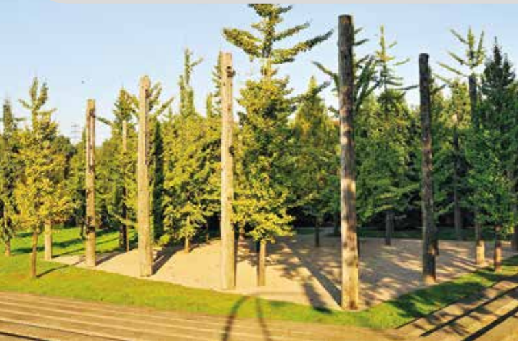
Gehölzgarten Ripshorst, Oberhausen