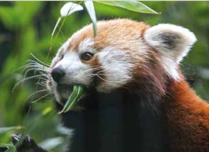
Grüner Zoo Wuppertal