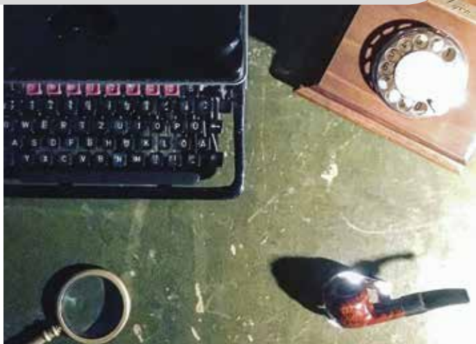
Live-Escape „LOCKED“, Bochum