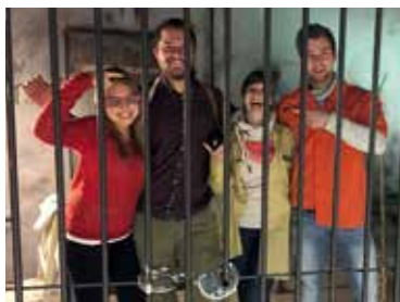
„Wir schaffen das!“ Gemeinsam den Ausgang finden – beim TeamExit in Viersen .

Den Ausgang finden und dabei nicht die Orientierung verlieren! Das gelingt den Spielern beim TeamExit in Viersen nur gemeinsam. Das alte Fabrikgelände an der ehemaligen Feldmühle ist die perfekte Kulisse für ein echtes Abenteuer. In vier verschiedenen Räumen können sich Gruppen mit bis zu