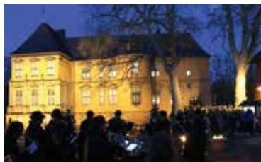
Das Schloss Rheydt in Mönchengladbach ist der perfekte Ort für einen außergewöhnlichen Weihnachtsmarkt.

schen Gebäude mit Blick auf modernes Handwerk aus liebevoller Kleinproduktion – das ist das Rezept des jährlichen Weihnachtsmarkts auf Schloss Rheydt in Mönchengladbach, in diesem Jahr am 5. und 6. Dezember. Das Weihnachtsshoppingangebot ist groß: Schals, Handschuhe und andere Textilien, aber auch schöne Keramik, nostalgisches Spielzeug oder schicker Schmuck. Und was wäre ein Weihnachtsmarkt ohne Köstlichkeiten? In den Schlosshöfen duftet es nach Kaffee, Crêpes, Glühwein, Suppe und Bratwürstchen. Der Eintritt beträgt 6 Euro, ermäßigt 4 Euro.