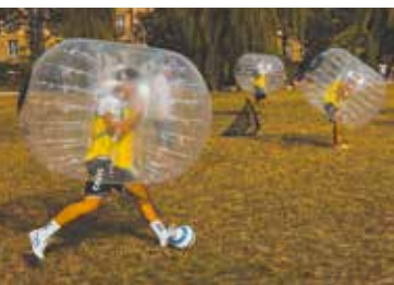
Fußball in großen Airbags: Das ist Bubble Ball Soccer .

Ein Mix aus Tennis und Squash, das ist – kurz erklärt – Padel-Tennis. Im Gegensatz zum normalen Tennis wird Padel immer zu viert gespielt, das Feld ist deutlich kleiner, die Schläger sind kürzer und der Ball ist dem Squashball sehr ähnlich. Und wie beim Squash ist der Platz eingezäunt – meist durch eine verglaste oder gemauerte Wand. Die darf ebenso gespielt werden wie das Feld. Die Augen müssen beim Padel deshalb überall sein: oben,