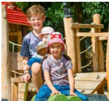
Großer Spaß für die Kleinen, Entspannung für die Großen: im Bobbolandia .

Im Bobbolandia in Grevenbroich fällt die Auswahl schwer: Erst auf die Riesen-Ritterburg oder erst auf den Rutschenturm? Oder doch lieber eine Runde Kart fahren? Zusammen mit dem roten Drachen Bobbo erkunden Kids und Teens über 30 Spielattraktionen. Das Hexenbaum-