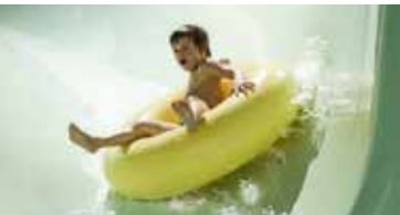
Rutschspaß beim Wildwasserrafting auf der Reifenrutsche im H2O in Remscheid .

ist voller unvorhersehbarer Kurven, Wellen und plötzlicher Steilhänge. Selbst erfahrenen Rutschenprofis entlockt sie den einen oder anderen Schrei. Doch auch die 8 Meter lange Steilrutsche ist ein echtes Abenteuer! Hier dauert es nur ein paar Sekunden, bevor es mit Schwung ins Wasser geht. Zum Teil dunkel und sehr eng wird's dagegen in der schmalen Röhrenrutsche. Aber auch für die ganz Kleinen gibt es im H2O Remscheid ein großes Angebot.