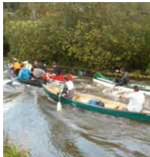
Mit dem Kanu über die Erft fahren und sich auf den Wasserfall freuen.

insel Hombroich in Neuss einlegen. Sie lockt mit einer wunderbaren Park- und Auenlandschaft sowie frei stehenden Ausstellungspavillons sowohl Natur- als auch Kunstliebhaber an. Sind alle Kanuten wieder an Bord? Dann auf zum großen Highlight des Ausflugs: der Wasserfall! Ein abenteuerliches Erlebnis in dem sonst eher ruhigen Gewässer, bei dem garantiert alle ein wenig nass werden. In Neuss-Weckhoven endet die Tour. Erfahrene Paddler können den Flussabschnitt mit eigenem Kanu kostenfrei befahren. Für alle anderen bietet Kanutouren Rheinland eine begleitete Tour mit geliehenen Kanus an.