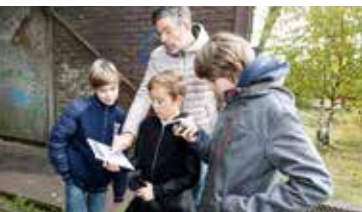
Gemeinsame Schatzsuche im alten Hüttenwerk in Duisburg.

Im Landschafts- und Naturschutzgebiet Wagenbruch in Castrop-Rauxel heißt es: Augen auf. Denn wenn Ihnen dort Wanderer mit tierischen Begleitern begegnen, sind