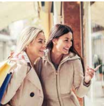
Nijmegen: Hier schlagen Shoppingherzen höher.

keit erfüllt. Denn in Nijmegen trifft Römergeschichte auf hippen Zeitvertreib. So sind es nur 10 Minuten Fußweg von der ältesten Einkaufsstraße Hollands in der Altstadt, der Lange Hezelstraat, bis zum Stadtstrand De Kaaij unter der Waalbrücke. Hier wird getanzt, gesungen, Theater gespielt und Yoga praktiziert – alles mit den Füßen im Sand. Was Sie sich außerdem nicht entgehen lassen sollten: Das Museum De Bastei, Naturkunde- und Kulturgeschichte-Museum in einem, den Kronenburgerpark, wunderschön angelegt mit einem kleinen Kinderspielplatz und Resten der mittelalterlichen Stadtmauer, oder – typisch niederländisch – das Nationale Fahrradmuseum Velorama. Ganz klar nur eine kleine Auswahl von Highlights der niederländischen Nachbarschaft. Mit dem RE 10 bis Kleve oder dem RE 19 bis Emmerich und dann jeweils mit dem SB 58 bis Nijmegen Centraal Station – schon sind Sie in der Innenstadt.